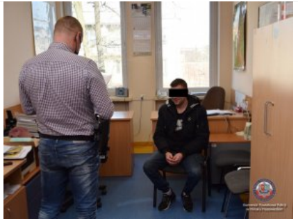
Policjant z zatrzymanym