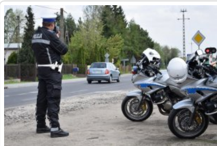
Policjanci podczas czynności służbowych związanych z nadzorowaniem ruchu drogowego