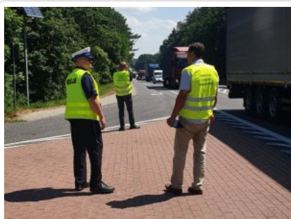
Wspólne działania z WIOŚ-em