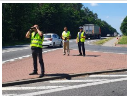
Wspólne działania z WIOŚ-em