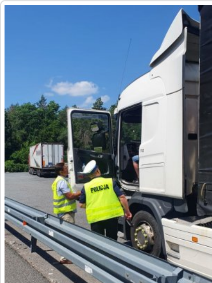
Wspólne działania z WIOŚ-em