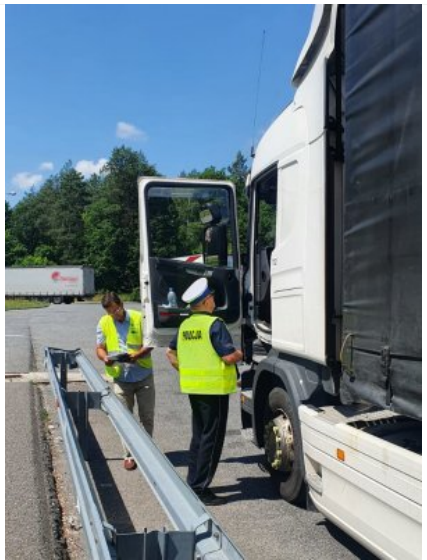
Wspólne działania z WIOŚ-em