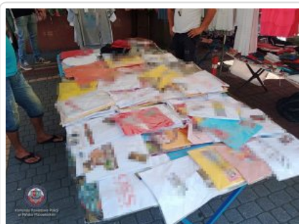
Odzież zabezpieczona przez policjantów