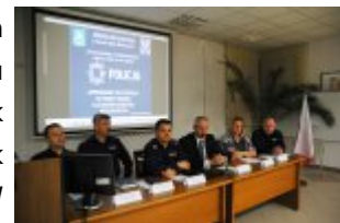
Debata Społeczna w gminie Mińsk Mazowiecki - „Porozmawiajmy o bezpieczeństwie - możesz mieć na nie wpływ”

W trakcie debaty najwięcej uwagi poświęcono bezpieczeństwu w miejscach publicznych, a także w ruchu drogowym. Radni i mieszkańcy wskazywali newralgiczne punkty, w których pojawiają się zagrożenia, apelując o kontrole Policji oraz podejmowanie działań mających nie tylko przeciwdziałać, ale też eliminować zagrożenia. Nie zabrakło również postulatów o działania drogówki, patrole rejonów szkół, kontrole przewożenia dzieci w fotelikach bezpieczeństwa i częstsze kontrole