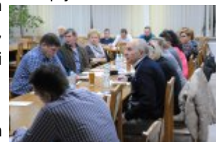
Debata Społeczna w gminie Mińsk Mazowiecki - „Porozmawiajmy o bezpieczeństwie - możesz mieć na nie wpływ”