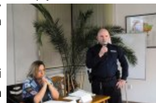
Debata Społeczna w gminie Mińsk Mazowiecki - „Porozmawiajmy o bezpieczeństwie - możesz mieć na nie wpływ”