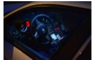
Policjanci drogówki podczas akcji "Twoje światła - Twoje bezpieczeństwo"