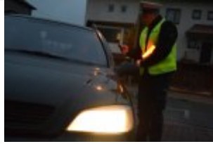
Policjanci drogówki podczas akcji "Twoje światła - Twoje bezpieczeństwo"