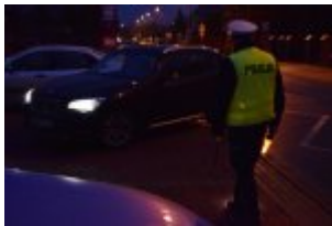
Policjanci drogówki podczas akcji "Twoje światła - Twoje bezpieczeństwo"