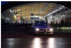
Policjanci drogówki podczas akcji "Twoje światła - Twoje bezpieczeństwo"