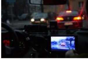
Policjanci drogówki podczas akcji "Twoje światła - Twoje bezpieczeństwo"