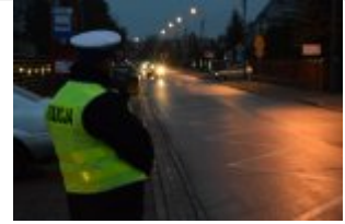
Policjanci drogówki podczas akcji "Twoje światła - Twoje bezpieczeństwo"