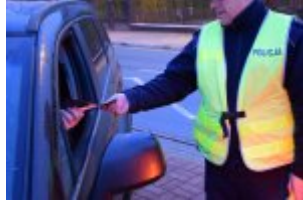
Policjanci drogówki podczas akcji "Twoje światła - Twoje bezpieczeństwo"