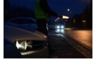
Policjanci drogówki podczas akcji "Twoje światła - Twoje bezpieczeństwo"