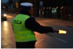
Policjanci drogówki podczas akcji "Twoje światła - Twoje bezpieczeństwo"