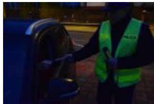
Policjanci drogówki podczas akcji "Twoje światła - Twoje bezpieczeństwo"